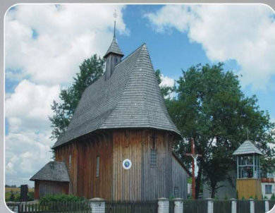
Kościół w Łaszewie