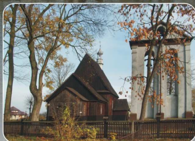
Kościół w Naramicach