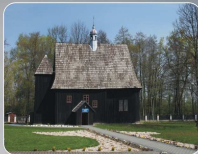
Kościół w Popowicach