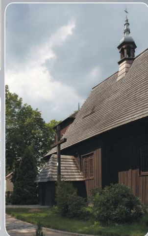
Kościół w Kadlubie