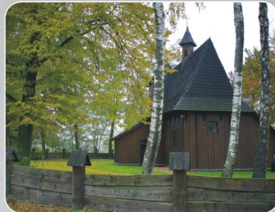
Kościół w Grębieniu

Ziemia Wieluńska znana jest z licznych i różnorodnych zabytków architektury drewnianej, jednak najcenniejszy, godny szczególnej uwagi jest zespół XVI-sto wiecznych, drewnianych kościółków rozlokowanych w okolicach Wielunia. Te jedyne w swoim rodzaju sakralne budowle, ze względu na swą unikatowość i łączące je wspólne cechy, nazwane zostały kościołami typu wieluńskiego. Po podhalańskich drewnianych kościołach Małopolski stanowią najcenniejszy w kraju zespół drewnianej architektury sakralnej.