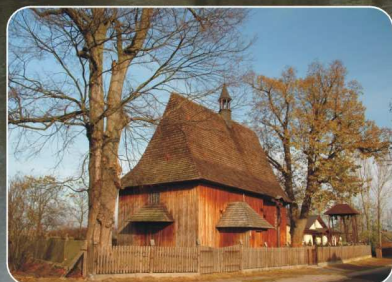
Kościół w Wiktorowie