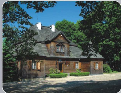
Dwór w Ożarowie