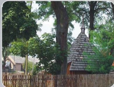
Kapliczka w Kamionie