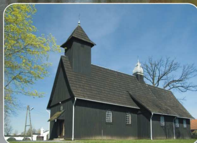
Kościół w Wierzbju