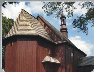
Kościół w Skomlinie