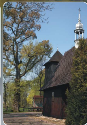
Kościół w Gaszynie