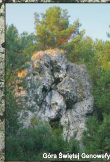
Góra Świętej Genowefy