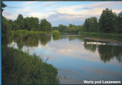
Warta pod Łaszewem