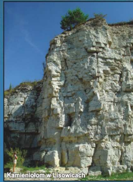
Kamieniołom w Lisowicach