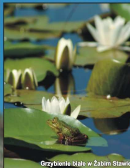
Grzybienie białe w Żabim Stawie