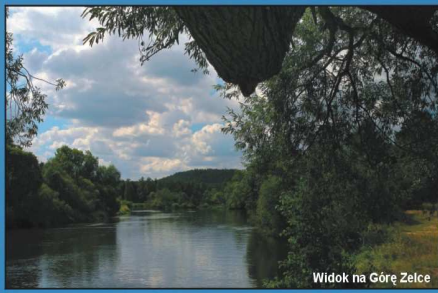
Widok na Górę Zelce