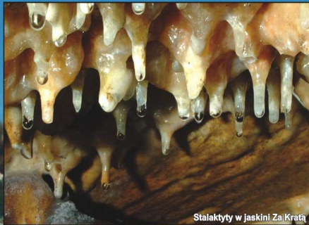
Stalaktyty w jaskini Za Kratą